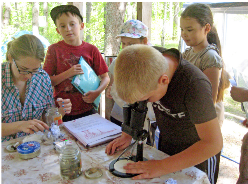
Фото 2. Камеральная обработка собранного материала. Национальный парк «Себежский», 2015 год.