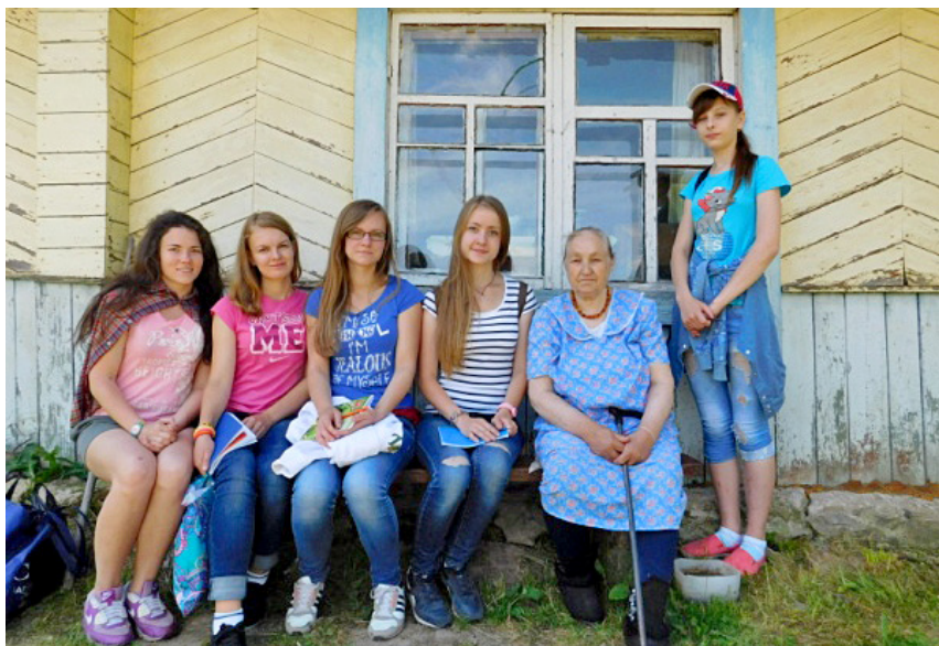
Фото 2. Группа лингвозтнографов и информант в г. Себеж. Областная детская комплексная краеведческая экспедиция «Истоки», 2015 г.