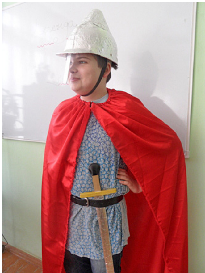
Фото 3. Участник проекта «Псковские богатыри – защитники земли Русской».

бабушек и дедушек, потом уже от своих родителей. Но родословную своей семьи имеют практически единицы. Ребята сначала утверждают, что ничего особенного о своей семье не знают, а потом выясняется, что, например, Столыпин прапрадеду гитару подарил. Во многих семьях хранятся вещи, ставшие реликвиями: фотографии начала XX века, награды, грамоты, украшения, но мы порой этого не замечаем и относимся к этому как к данности.