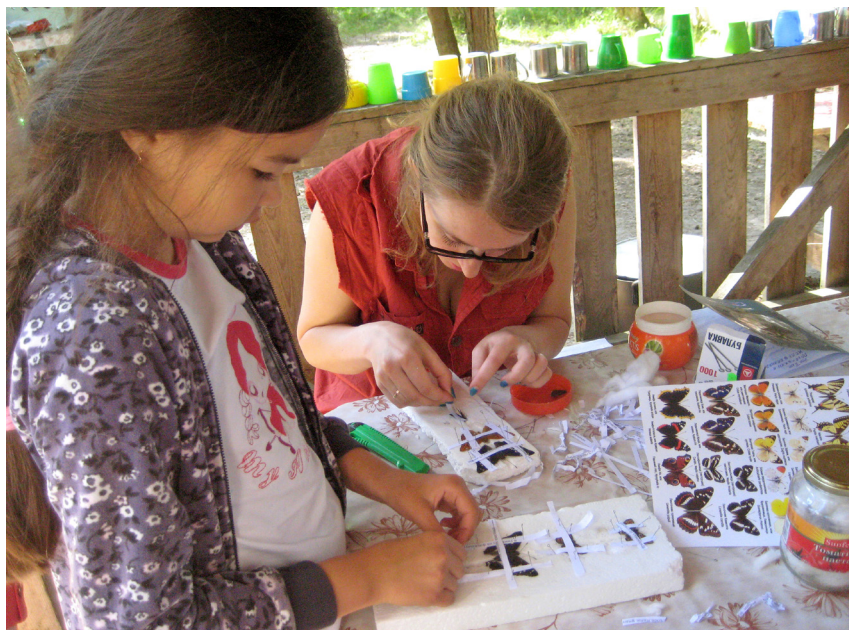
Фото 3. Фиксация чешуекрылых для коллекции. Национальный парк «Себежский», 2015 год.

Хотелось бы отметить, что дети, находящиеся в трудной жизненной ситуации, имеют возможность стать участниками экспедиции. Они попадают в среду, где особое значение имеют общечеловеческие ценности, ко всем предъявляются одинаковые требования, где все имеют равные шансы на успешное проведение исследования, написание научной статьи и защиту работы на конференции, а значит, и равные шансы на развитие. Ежегодно автор статьи наблюдает, как участники экспедиции становятся настоящими друзьями, помогают друг другу, несмотря на то, что у каждого своя тема работы. Общее дело объединяет, общие высокие требования заставляют подтянуться в учебе, а высокий уровень исследовательских работ, как результат собственного труда, создает ситуацию успеха и помогает поверить в себя. Особенно это важно для детей, находящихся в трудной жизненной ситуации. Вот почему, приехав один раз в экспедицию, ребята ждут следующего лета, готовятся к новым исследованиям и совершенствуются каждый год.