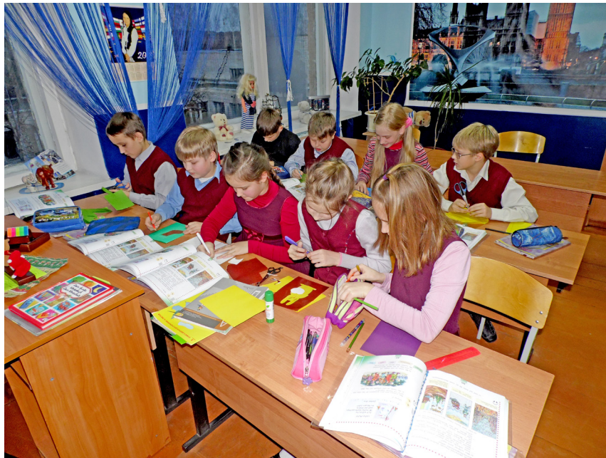
Фото 1. Подготовка материалов, 4 класс, МАОУ «Лицей № 11», г. Великие Луки.

мотивация – интерес ребенка и желание заниматься какой-либо деятельностью, возможность реализовать свои способности, получить признание и поощрение и даже