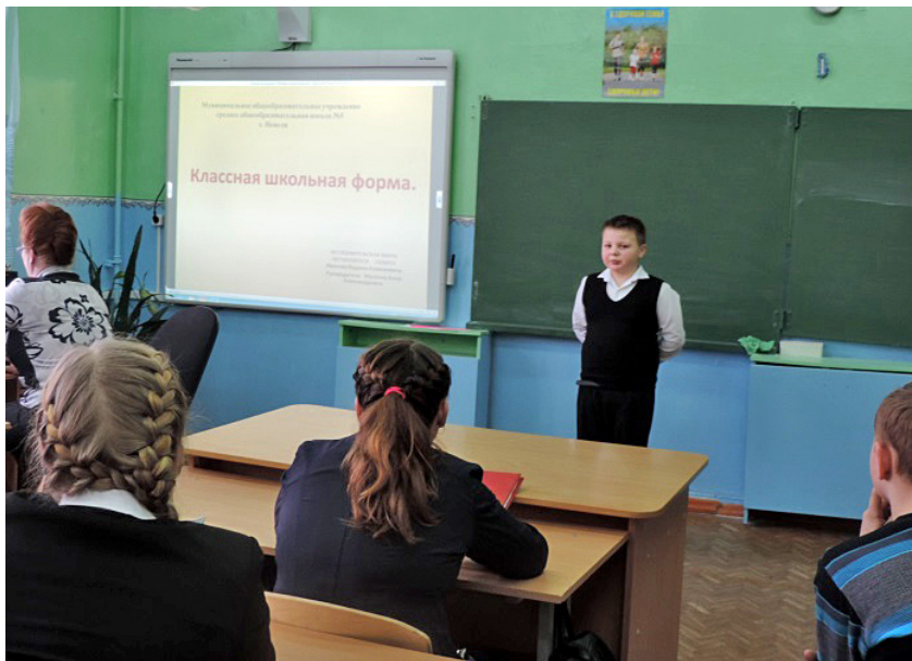
Фото 1. Секционная защита работы, школьная исследовательская конференция МБОУ СОШ №5 им. В.В. Смирнова, г. Невель.

Обучающиеся выступают со своими исследованиями на уроках, классных часах. Итоговым мероприятием является ежегодная школьная научно-исследовательская конференция. На ней школьники представляют свои работы по разным направлениям: литературное, естественнонаучное, математическое, лингвистическое, социальное, краеведческое, по здоровому образу жизни. Участниками становятся обучающиеся с первого по десятый класс. Особую значимость придают данному событию дети, находящиеся в трудной жизненной ситуации. Они свободно конкурируют со всеми обучающимися, а также показывают высокие результаты.