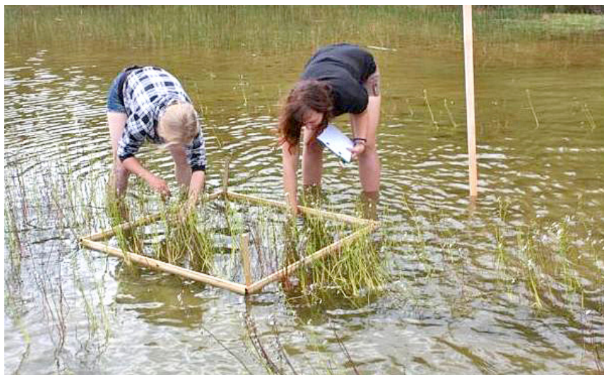
Фото 2. Поездки участников проекта «София». Изучение Щирского озера, места произрастания краснокнижных видов растений.