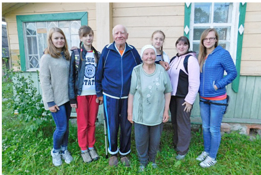
Фото 3. Группа лингвозтнографов и информанты в дер. Дворище. Областная детская комплексная краеведческая экспедиция «Истоки», 2015 г.