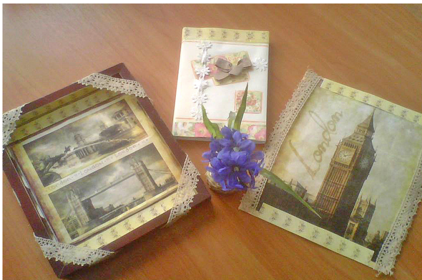
Фото 2. Работы старшеклассниц МАОУ «Лицей №11», г. Великие Луки.

просто иметь возможность такой деятельности – танцевать, рисовать, музицировать, одним словом: творить;