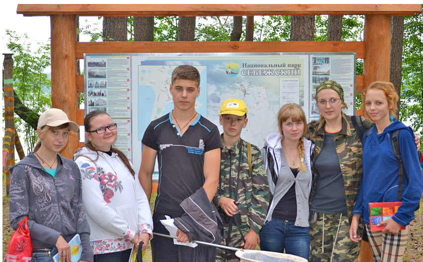
Фото 1. Группа зоологов на экологической тропе «Большой Гребел». Национальный парк «Себежский», 2014 год.