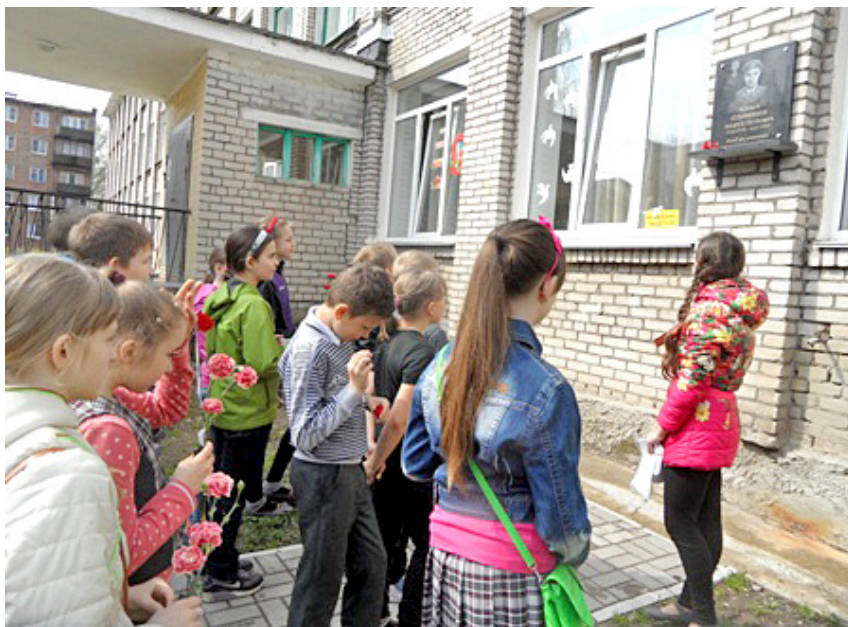
Фото 2. Экскурсия по проекту «С чего начинается Родина...».

столов», дискуссий, дебатов, интеллектуальных игр, публичных защит, конференций и др., а также встречи с представителями науки и образования, экскурсии в учреждения науки и образования;