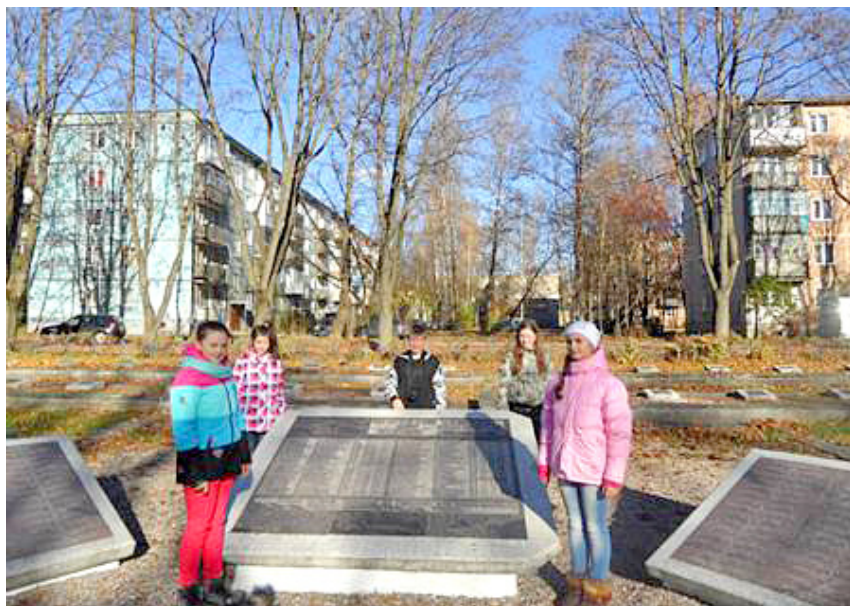
Фото 1. Работа по проекту «С чего начинается Родина...». Разработка экскурсионного маршрута.

деятельностный характер воспитания; принцип успеха.