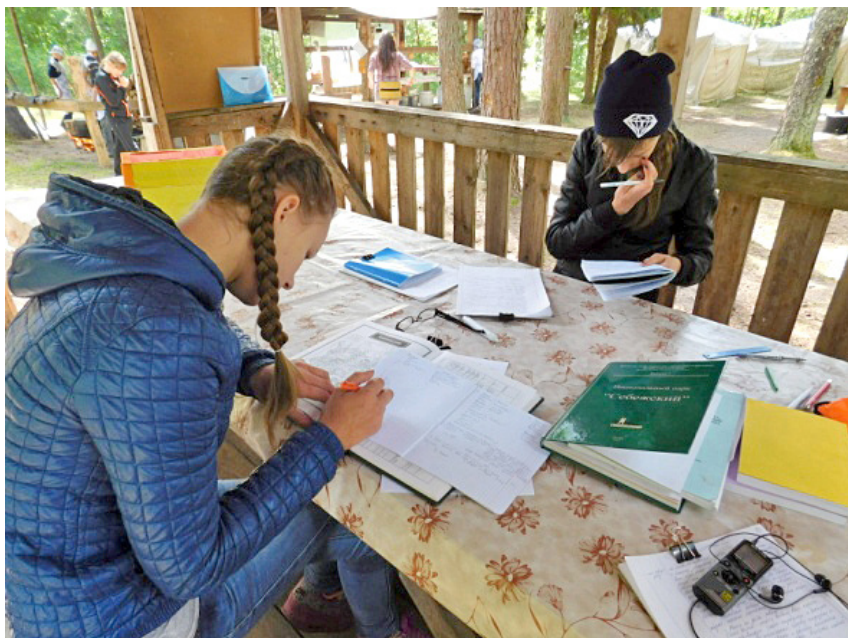
Фото 1. Камеральная обработка бесед с информантами. Областная детская комплексная краеведческая экспедиция «Истоки», 2015 г.