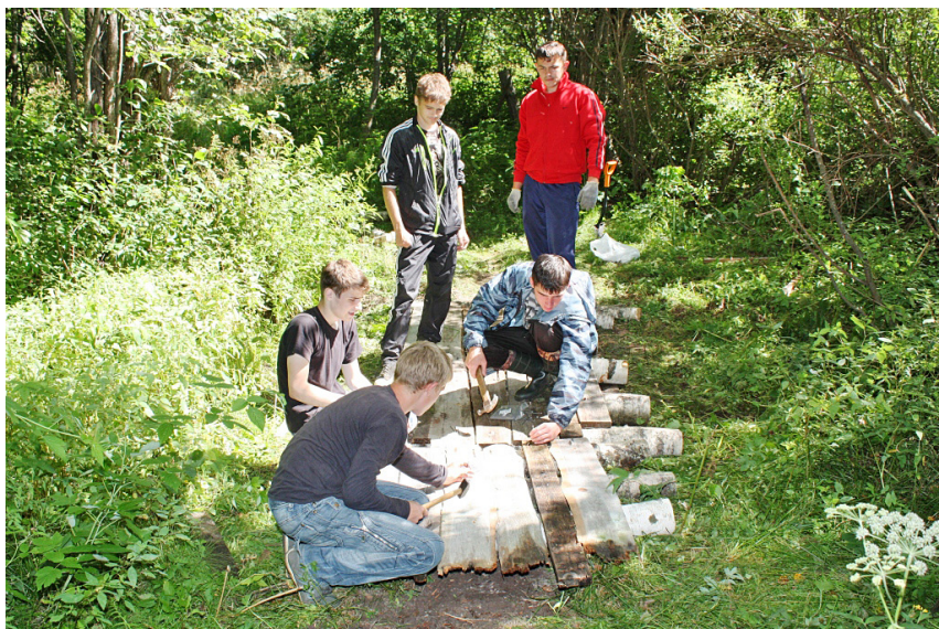
Фото 1. Поездки участников проекта «София». Строительство мостика на тропинке к Никольскому источнику.